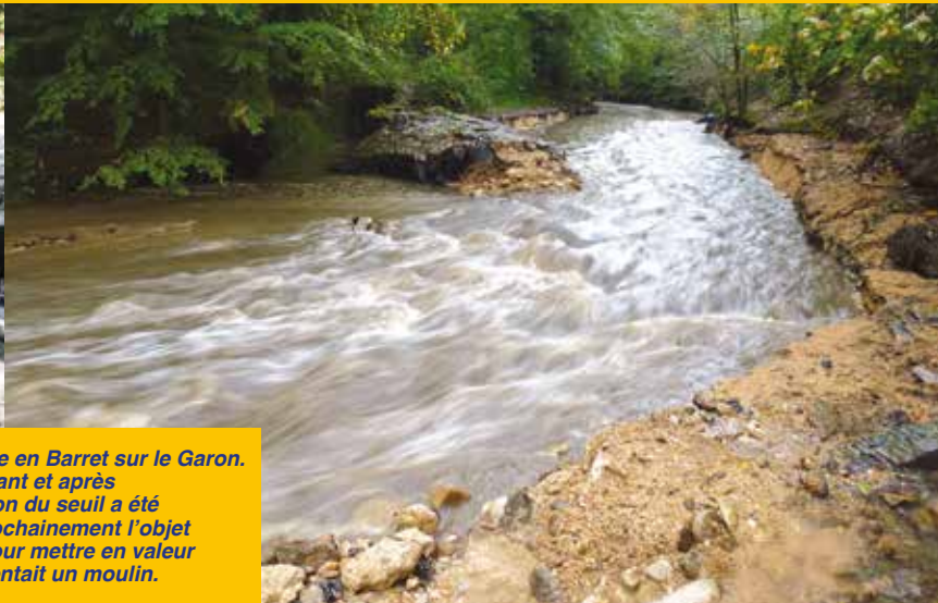
Le seuil aval de la vallée en Barret sur le Garon. De gauche à droite : avant et après l'effacement. Une portion du seuil a été conservée. Elle fera prochainement l'objet d'une requalification pour mettre en valeur l'ancien canal qui alimentait un moulin.