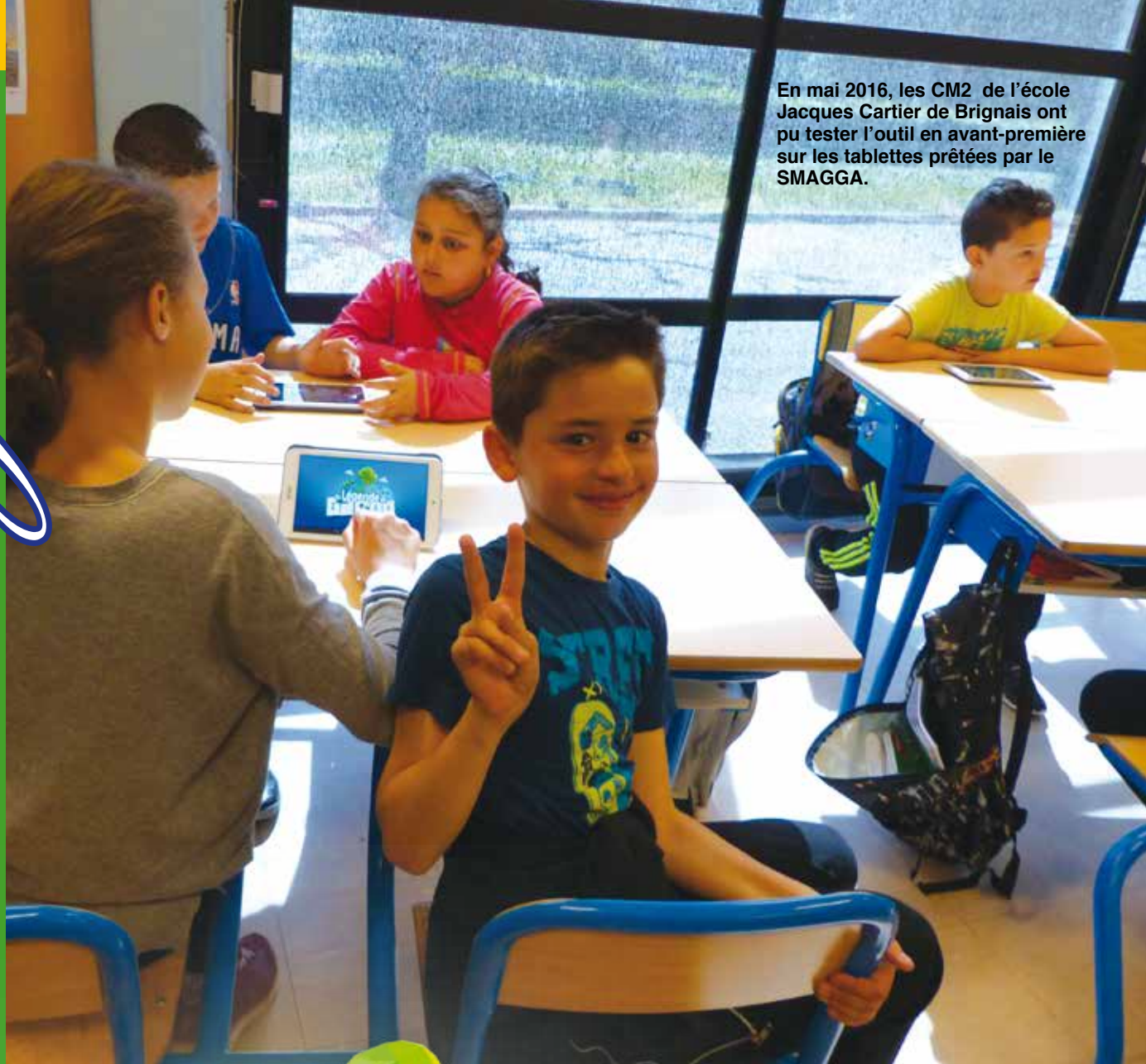
En mai 2016, les CM2 de l'école Jacques Cartier de Brignais ont pu tester l'outil en avant-première sur les tablettes prêtées par le SMAGGA.